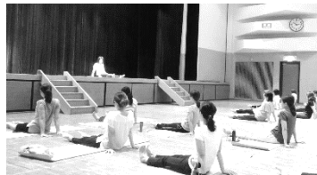
(上写真：幼稚園での家庭教育学級/開成町)