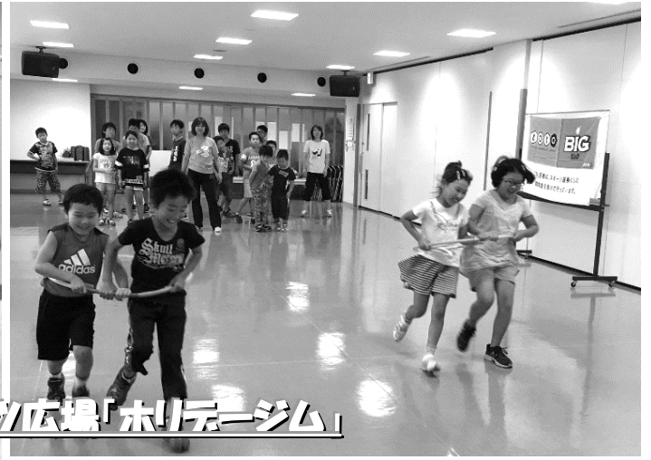
楽しくのほすスポーツ広場「ホリデージム」